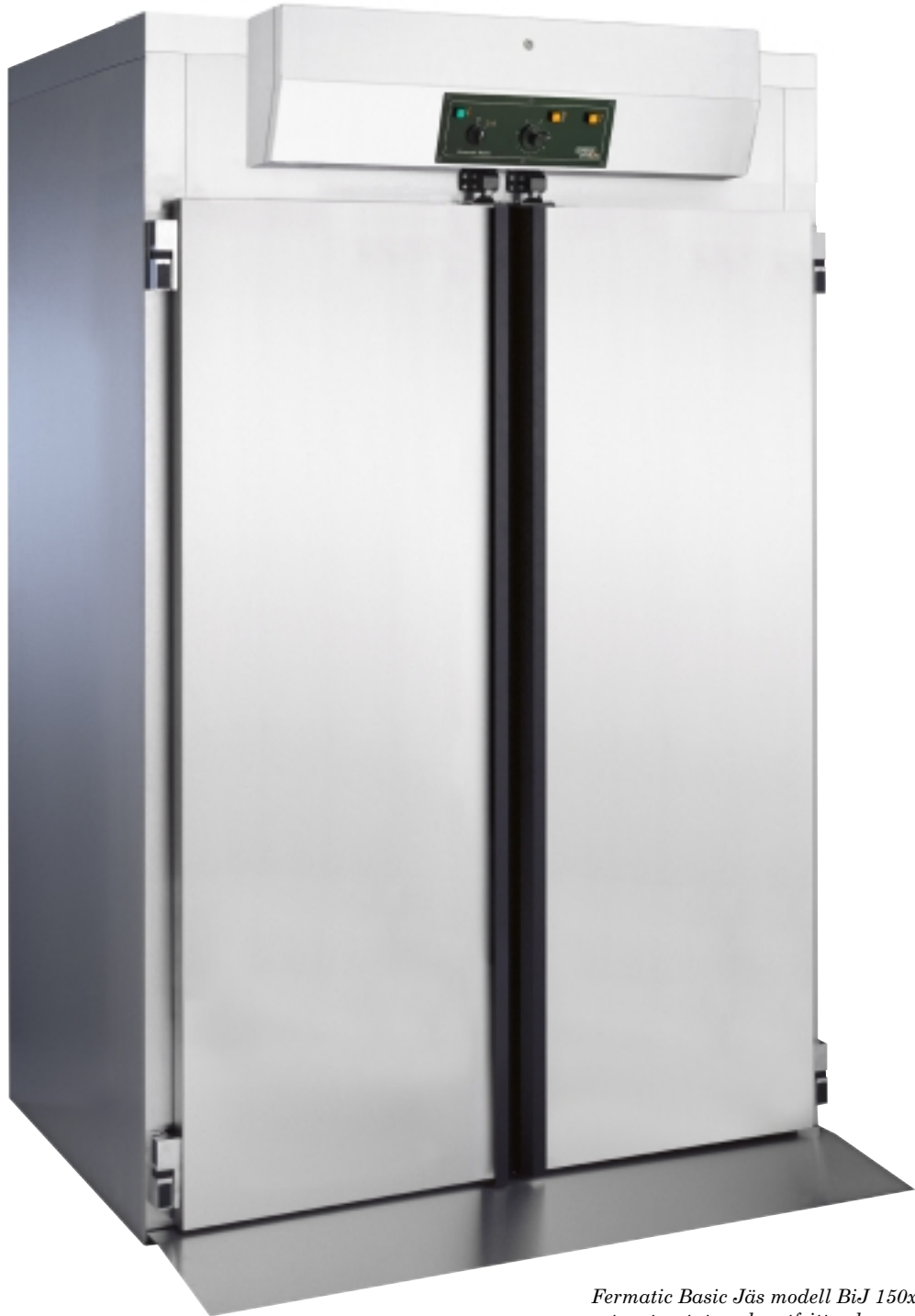
Fermatic Basic Jäs modell BiJ 150x100 extrautrustat med rostfritt golv.