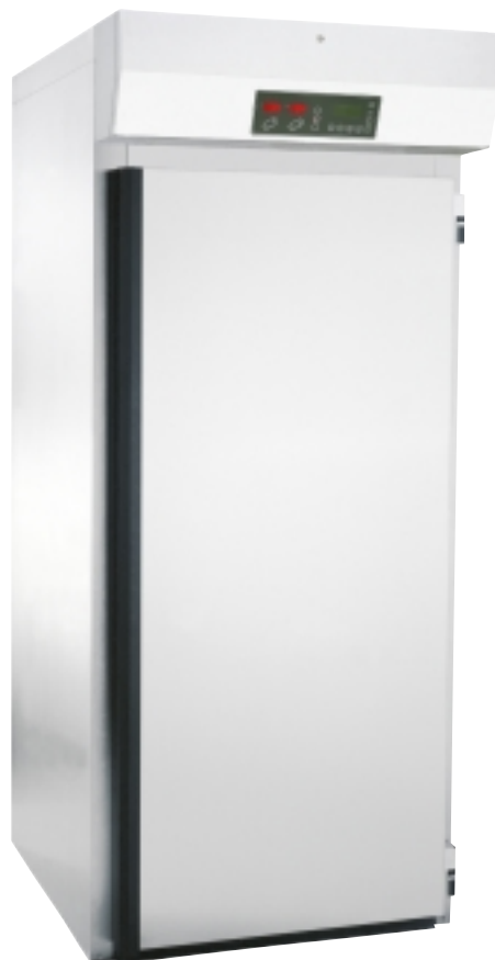
Fermatic Basic Kyl-Jäs modell BiK 98x100.